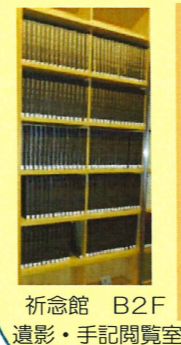
祈念館 B2F 遺影・手記閲覧室

黒本とは… 平成7年度・17年度に厚労省が実施した被爆者実態調査の際に、収集した被爆体験記のうち、祈念館での公開に同意があったものを収録したものです。