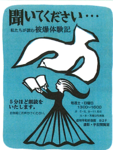
国立長崎原爆死没者追悼平和祈念館 被爆体験記朗読ボランティア 被爆体験を語り継ぐ 永遠の会