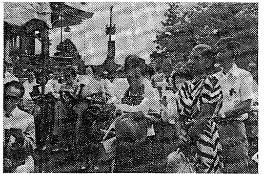
除幕ののち、参加者全体で“お 山の杉の子”を斉唱するかつての 児童と教職員たち。涙ぐみ、だき 合う姿も。苦しい思い出の中から 二度とくり返さない平和の誓いを。